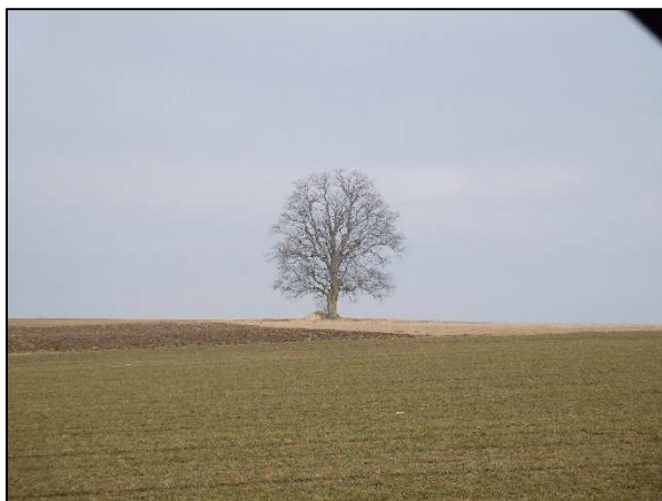
Osamělý strom v náhorních polích Petrovic-Petroviček