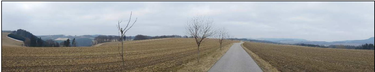
Panorama polí nad Maršovem (U kříže)