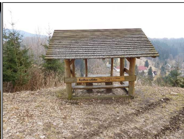
Vyhlídky Kyrill nad Maršovem